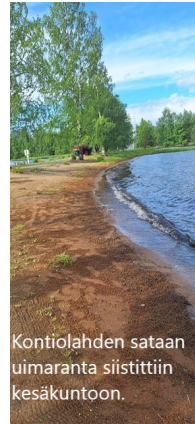
Kontiolahden sataan uimaranta siistittiin kesäkuun.